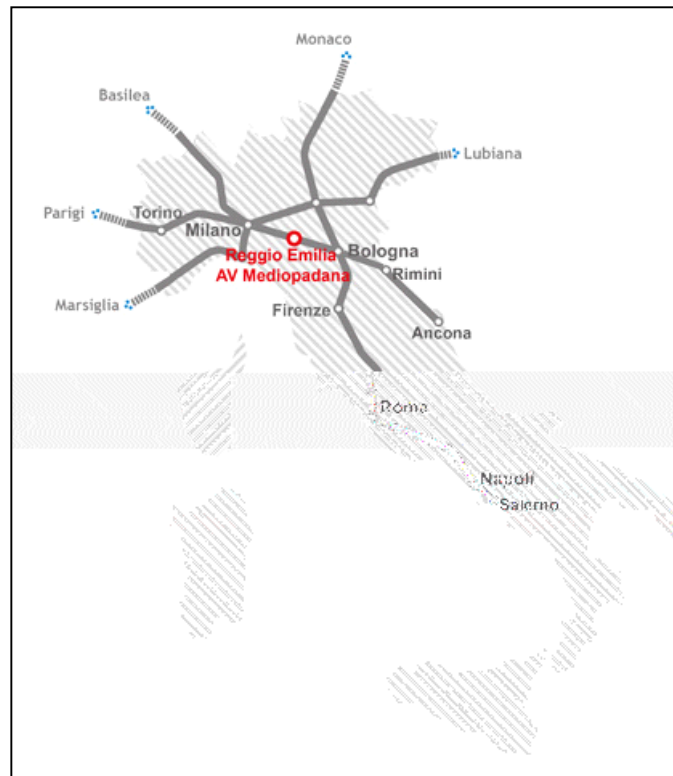
Fermata AV Mediopadana – Reggio Emilia